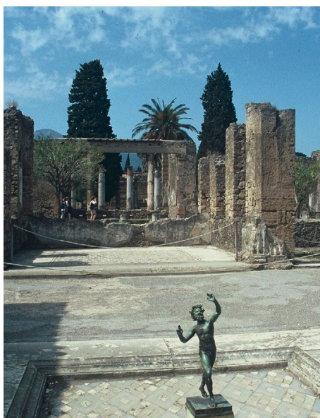
Schönheit dieser Trauminsel.